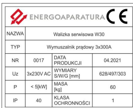
Rys. 2. Tabliczka znamionowa walizki W-30

Oznaczenie znakiem CE wykonano w 2014r. Oznaczenie wykonane jest na tabliczce znamionowej (Rys. 2.) na wieczku walizki. Na tabliczce znamionowej umieszczono podstawowe parametry walizki serwisowej W-30.